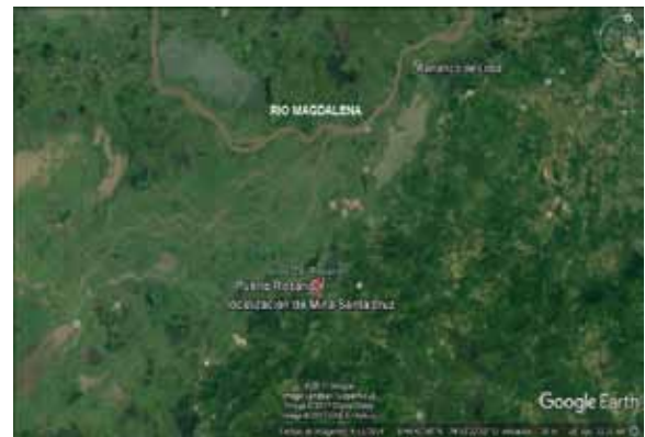
Figura 1. Mina de Santa Cruz, departamento de Bolívar, Colombia.

demarcado se recolectaron muestras de suelo y suelos con raíces de plantas; las cuales fueron rotuladas y conservadas para su transporte. Las muestras de suelo fueron utilizadas para caracterización física-química en el laboratorio de suelos y aguas de la Universidad de Sucre y las muestras de suelos más raíces se utilizaron para el aislamiento de bacterias rizosféricas y pruebas de resistencia in vitro a diferentes concentraciones de mercurio.